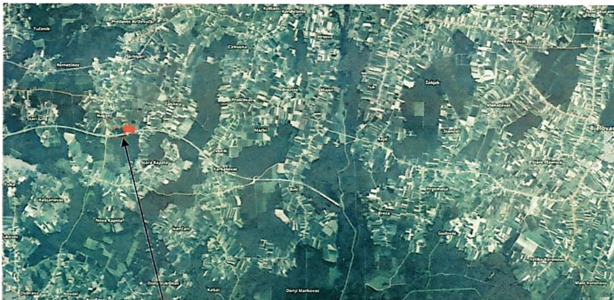
k.č.br. 752/3, 733/29, 733/31, 733/32 i 733/33 k.o. Haganj